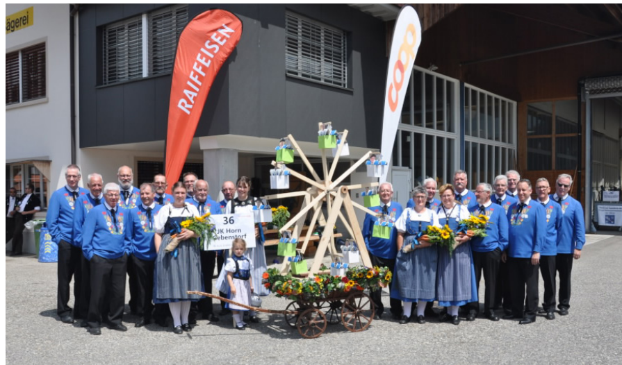
Jodlerklub vor dem Umzugsstart am Jodlerfest 2019